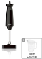
도깨비 방망이 V9000 (사은품: 대용량 2200ml 컵)