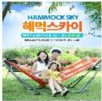
해먹 인디스카이 (인디스타/블루 색상 선택)