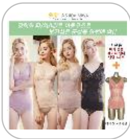
아키 보정 란주 웨이퍼 11종