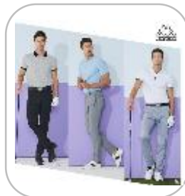
[초특가] 카파(Kappa) 썸머 골프팬츠 3종