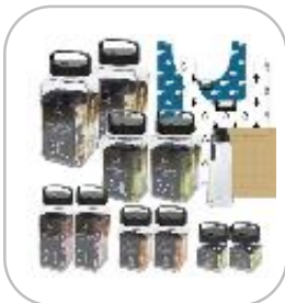
[락앤락] 숨쉬는 유리용기 10종세트