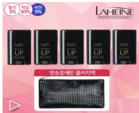
라헨스 더블업 볼룸커버스틱(본품5개+클러치백)