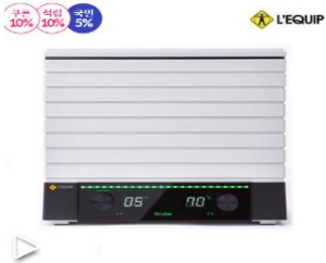
리quip 와이드 대용량 식품 건조기 (LD-9013)