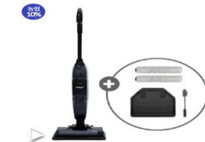
[파격기획가!!] 벤투스 아쿠아 맥스 무선청소기