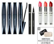
신데렐라스토리] 에어볼륨 마스카라 패키지