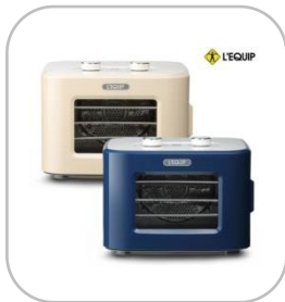
리quip 미니 식품건조기