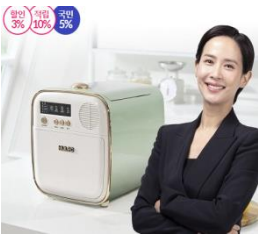
휴렉 히어로 음식물 처리기