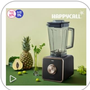
해피콜 초고속블렌더 뉴트로