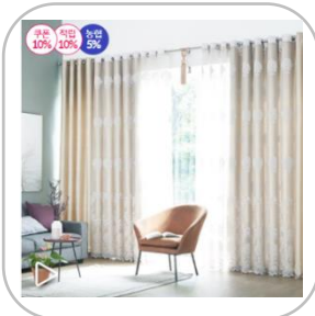
블랑휴 로맨틱 이중 레이스 암막커튼 풀세트