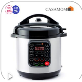
까사맘 압력 스마트쿠커 대용량 6L