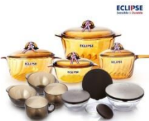
이클립스 내열유리냄비 세트