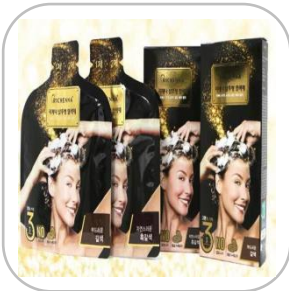
리체나 샴푸형 3분 염색제