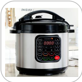
까사맘 압력 스마트쿠커 대용량 6L