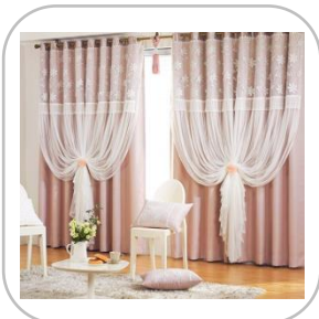
지나송 시그니처 웨딩라인 암막커튼 풀세트