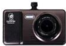
캐치온 블랙박스 팬텀 2CH(32G)