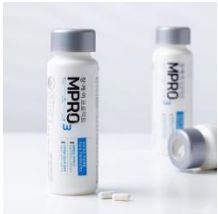
한국 야쿠르트 장케어프로젝트 MPRO3