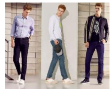
[파격특가] 레이지카키 매직 데님팬츠 3종_남성