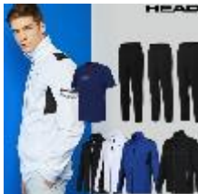
헤드 퍼펙트 수트 4종_남성용