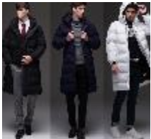
릴리전 롱패딩 1종