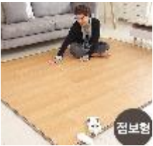
한솔 온돌마루 카페트 매트 점보형_KCC바닥재