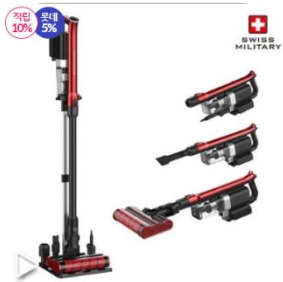
스위스밀리터리 트윈에어 무선청소기