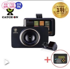
캐치온 블랙박스 로열 2채널 32G+HUD 패키지