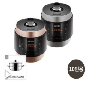
[쿠쿠] 고화력 전기압력밥솥