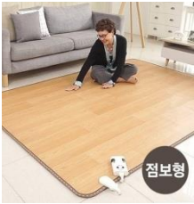
한솔 온돌마루 카페트 매트