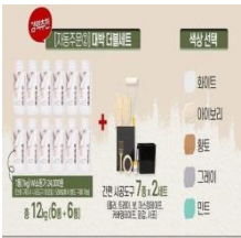
바르는 규조토 벽지 더건강함