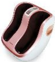
홈케어바디휴 슬림라인 종아리발 마사지기 BF-2000