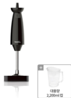
도깨비 방망이 V9000 (사은품: 대용량 2200ml 컵)