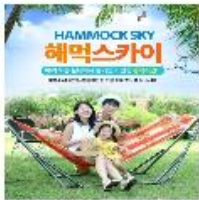
해먹 인디스카이 (인디스타/블루 색상 선택)