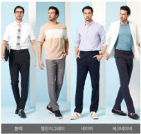
[선기획 특가] 비마코스키 여름 감탄팬츠 4종