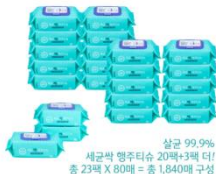
세균삭 행주티슈 1+1세트 (사은품 : 본품 3팩)