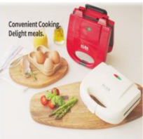
알로아 브런치메이커 1+1세트