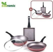
에코라믹 데일리 프라이팬