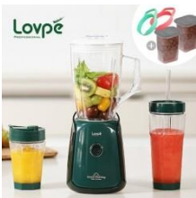
로페 굿모닝 테이크아웃 믹서기