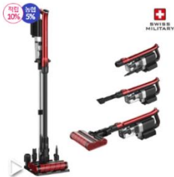
스위스밀리터리 트윈에어 무선청소기