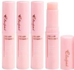
엘루자이 콜라겐 링클밤