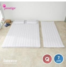
벨기에 LATEXCO 프리스티지 7존 라텍스 토퍼매트리스