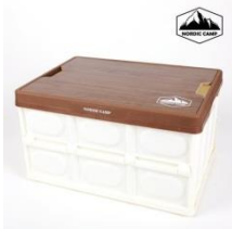
[노르딕 캠핑] 접이식 폴딩박스(우드상판)